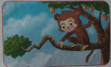
पेड़ पर बंदर बैठा है।