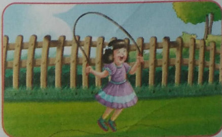
लीना खेल रही है।